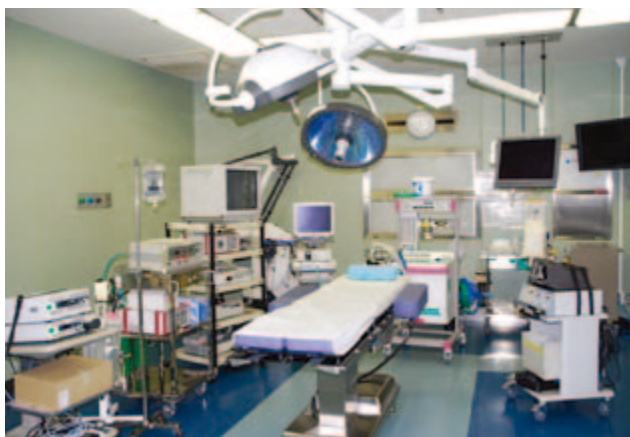
さまざまな手術に対応できるようにたくさんの器械が揃えてあります。